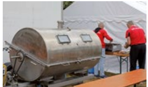
Manche Selbstversorger waren höchst professionell ausgestattet

Und Fußball wurde auch noch gespielt. Auch hier gibt es viele Zahlen zu vermelden. Die 374 Spiele mit insgesamt 869 Toren konnten nur durchgeführt werden, da 31 Helfer der A/B/C2 Jugend und ehemalige Jugendspieler als Spielaufsicht, Stadionsprecher und