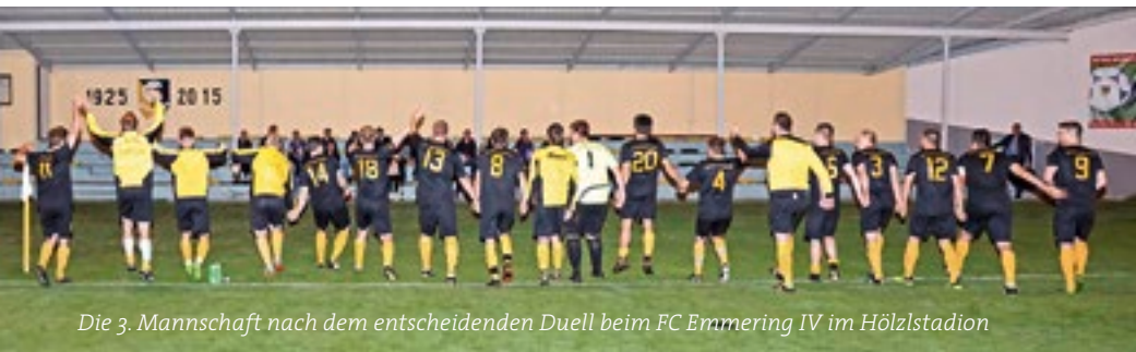
Die 3. Mannschaft nach dem entscheidenden Duell beim FC Emmerring IV im Hölzlstadion

Ein besonderes Kompliment gilt es dem Trainerduo Märkl / Hatzinger aus-