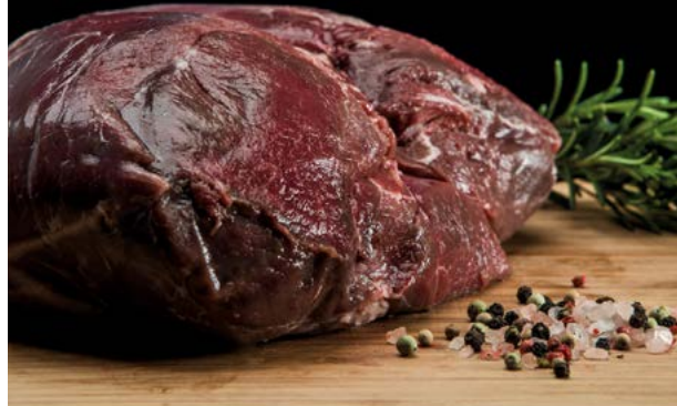
Rehkeule ohne Knochen 3,00 €/100 g