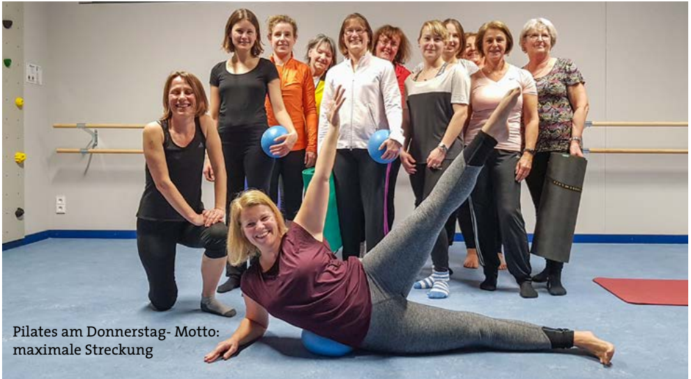
Pilates am Donnerstag- Motto: maximale Streckung