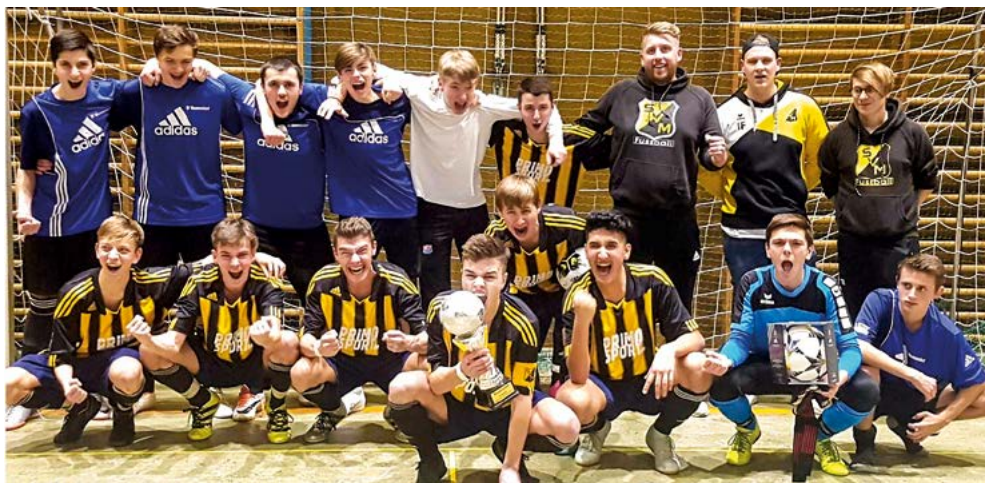
Überlegener Turniersieger: Die B Junioren feierten mit ihren Trainern den erhofften, aber nicht unbedingt erwarteten Turniersieg. Auch die Spieler von Mammendorf II freuen sich mit ihnen!

in einen schier endlosen Jubel aus. Im B1 Turnier traten wir auch mit zwei Mannschaften an, die allerdings mit höchst unterschiedlichem Erfolg ihre Gruppenphase absolvierten. Die eine Gruppensieger – die andere Gruppenletzter. Doch im Spiel um die Rote Laterne konnte sich SVM II nach einem spannenden Spiel, das bis zuletzt umkämpft war, mit 3:2 gegen Wildenroth durchsetzen. Im Halbfinale war SVM I gegen Unterpfaffenhofen klarer Außenseiter, doch konnten sie mit einem 2:0 ins Finale einziehen. Dort wartete der hohe Favorit aus Althegegnberg. Doch unsere Jungs